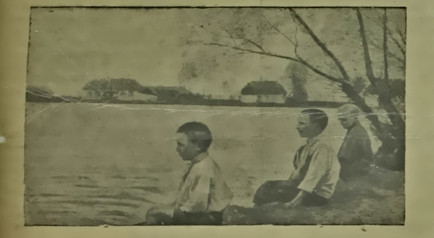
Талаўскі раён Варонежскага абласці размешчаны ў асаблівай зоне, дзе няма ніводнай рэчкі. Калгаснікі сельсагаспадарчай арцелі „Железнодорожник“ абав'язаліся пабудаваць новыя выдатныя пруды, адрамантаваць існуючыя пруды, арганізаваць паліўку гародніны. Адначоова яны завярнуліся з заклікам да ўсіх калгасцаў Варонежскага абласці паследзіць іх прыкладу.

Зараз на палях ідуць ажурыныя прапалочныя работы. За гадзіну час прапалочныя культуры 2376 гектараў, у тым ліку азійных 2150 гектараў, яравых 225 гектараў. Акрамя гэтага прапалочна 70 гектараў тэхнічных культур і 460 гектараў бульбы.