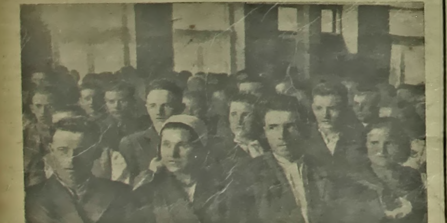
На сходзе маладых камсамольцаў Іружанскага раёна.

Дырэктар Брэсцкага музычнага вучылішча Ш. у Б. І.