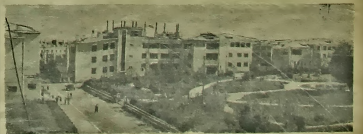
Мінск—сталіца Совецкай Беларусі. Агульны выгляд універсітэцкага гарадка.