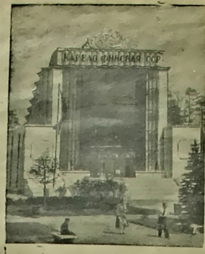
Павільён Карэла-Фінскай ССР на Усеагульнай Сельскагааспадарчай Выстаўцы.