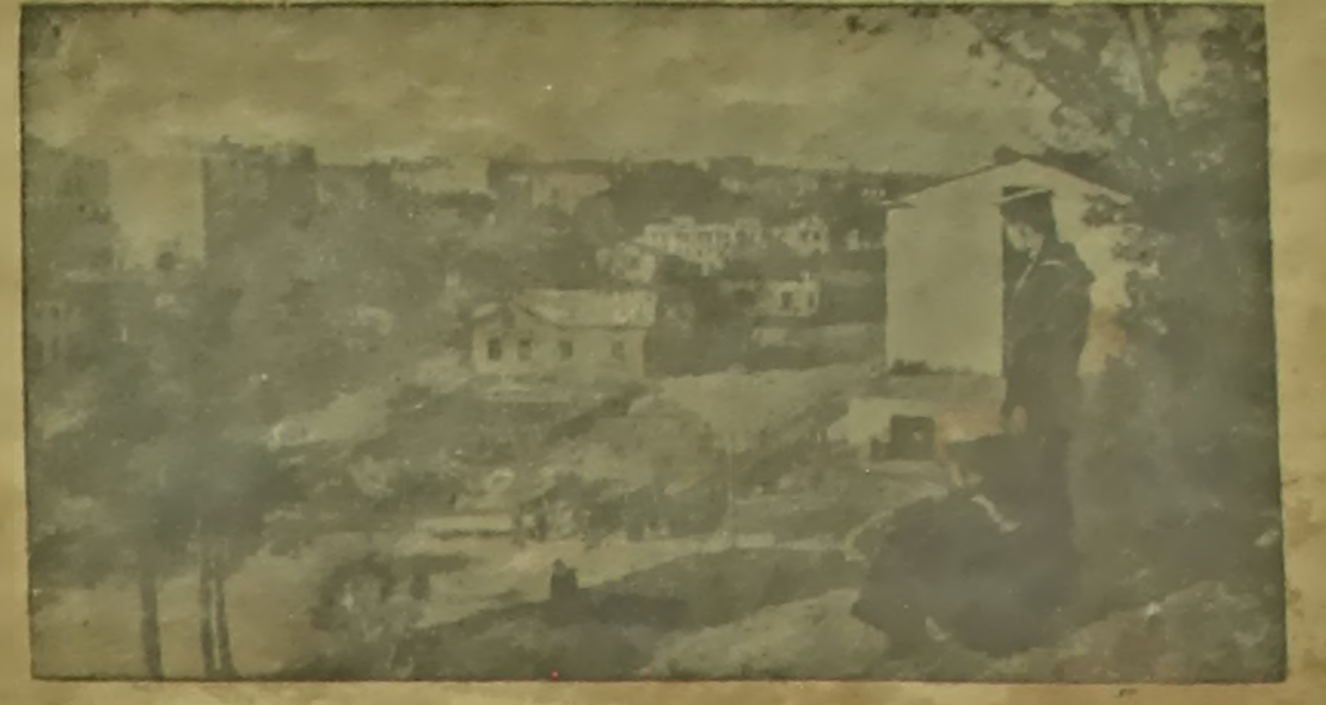
Па гарадах Савецкага Саюза. Від горада Вярбара.

Усе члены нашай сельскагаспадарчай арцелі працуюць эвентуальна. Сярод іх шырока разгорнуліся сацыялістычныя спаборніцтва. Праца ідзе дружна і прадукцыйна. Мы ўжо поўнасьцю закончылі ўборку зернавых культур. Жыво і шчыра праводзілася жніўня і ўборка. Пасяхава праходзіць у абсалютна збожжа.