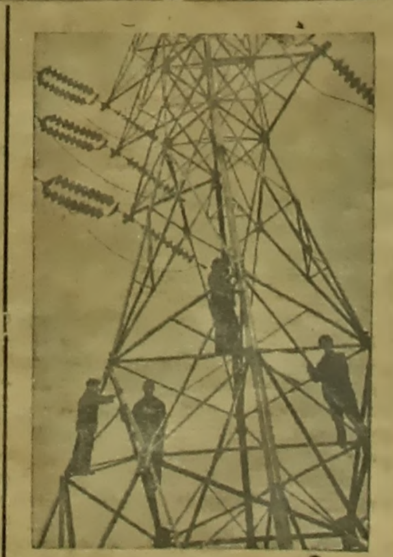
На будаўніцтве высокавольнай лініі электраперадачы Роўхіяла — Ленінград. Даўжыня лініі 157 кіламетраў. Гідрастанцыя Рохіяла (Карэла-Фінская ССР) даць Ленінграду электраэнергію. Рабочыя-малеры на машце высокавольнай лініі электраперадачы.