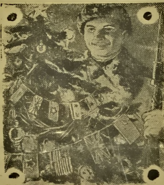
С НОВЫМ ГОДОМ, РЕБЯТА!

Слава ж воинам отважным, Слава труженикам тыла, Тем, чья воля силы вражьи В грозной сече сокрушила!