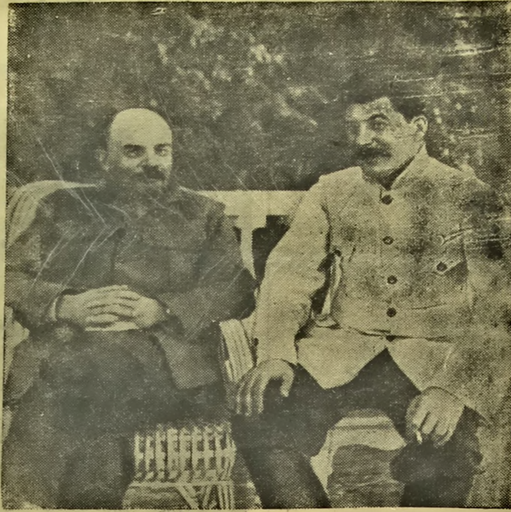
ЛЕНИН И СТАЛИН В ГОРКАХ.

В годы империалистической войны (1916 год) Ленин написал книгу „Империализм, как высшая стадия капитализма“. Опираясь на свою теорию империализма, Ленин научно обосновал возможность победы социализма первоначально в одной стране и невозможность одновременной победы социализма во всех странах. По вопросу об отношении к войне Ленин выдвинул лозунг поражения „своих“ правительств