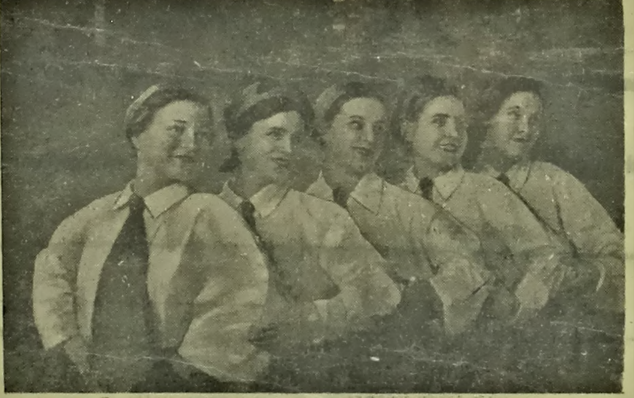
НА ЗДЫМКУ: эканцэнтрычны талец у выкавапі беднага калектыва.