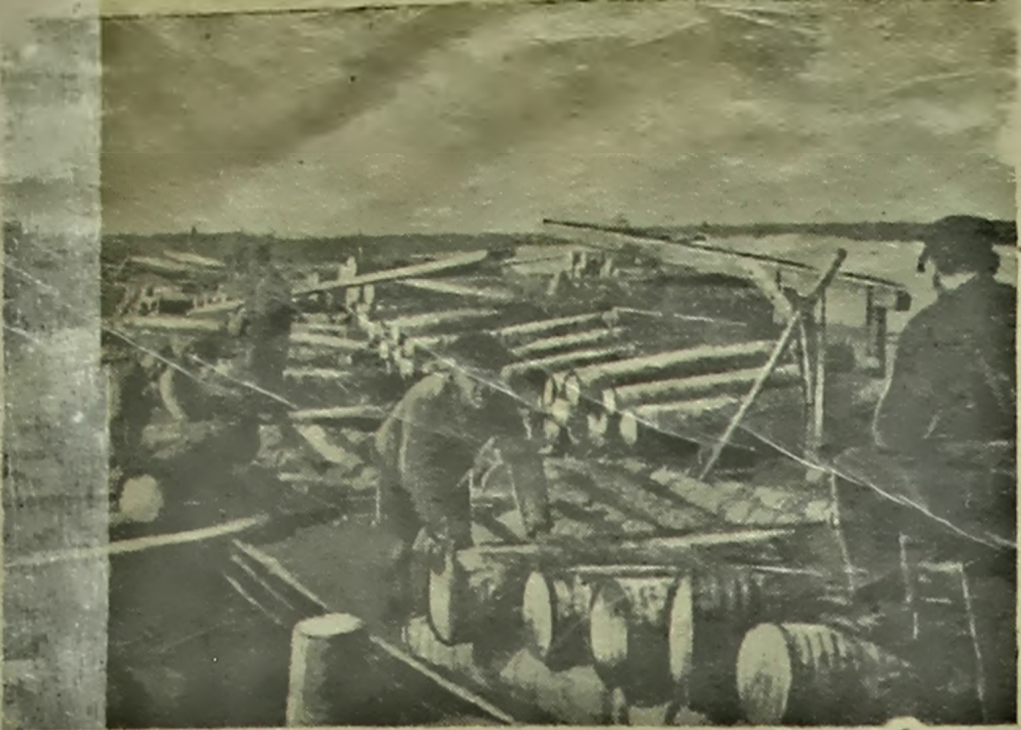
Пачынаюцца пагрузачна-разгрузачныя работы на Гаўненскай пляцоўцы Барысаўскай славянскай калоніі (Мінская абласць). На агульным: пагрузка лесамагярынаў на баржы для фанернага завода «Чырвоная Віроўна» № 25.