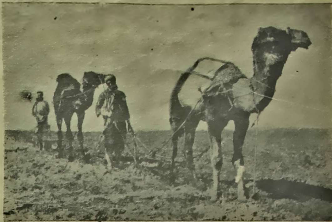
Палестынская сялянэ на вясняной палывоў рабоце.