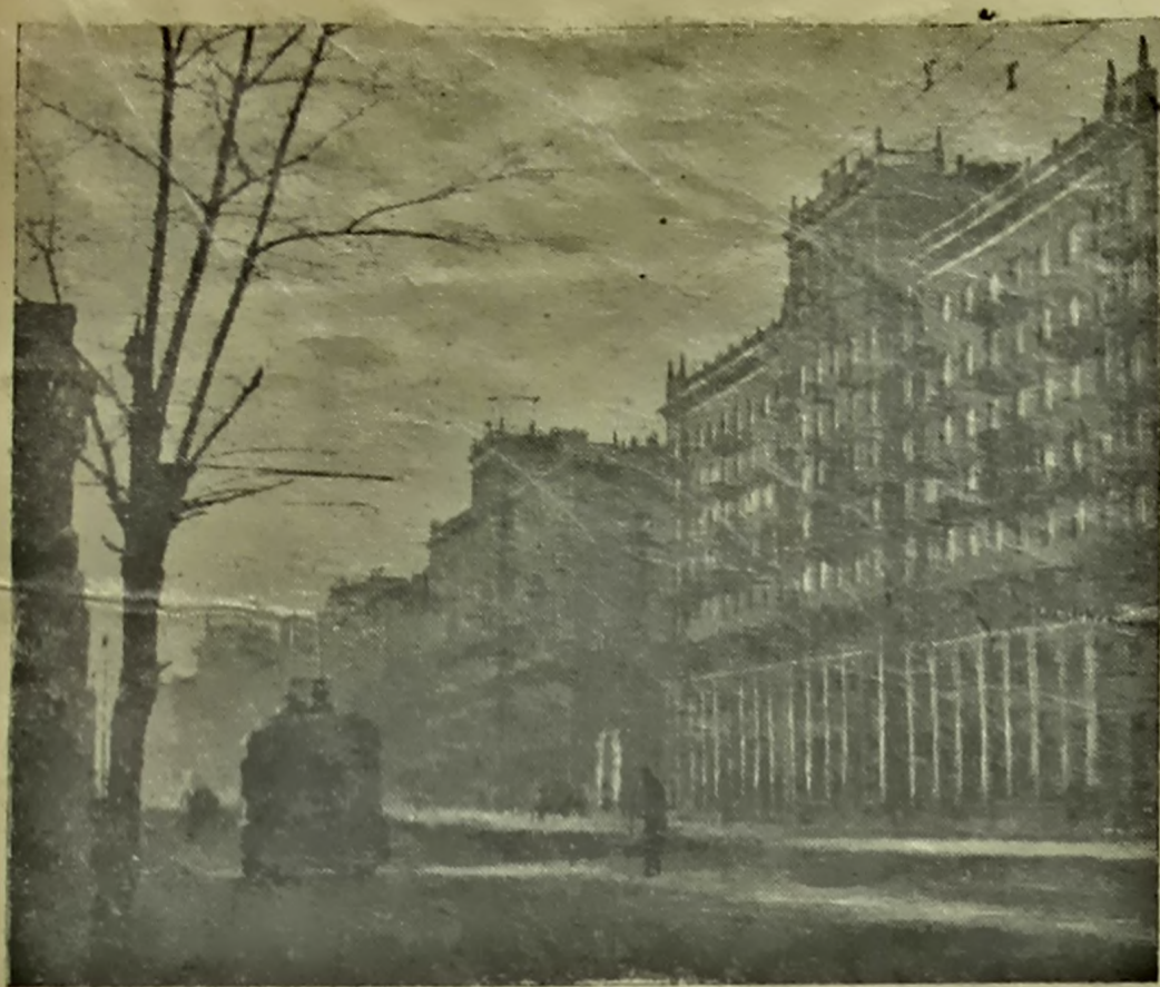
НА ЗДЫМКУ: Жыдаўскія дамы на Калужскім шасе (МАСКВА).