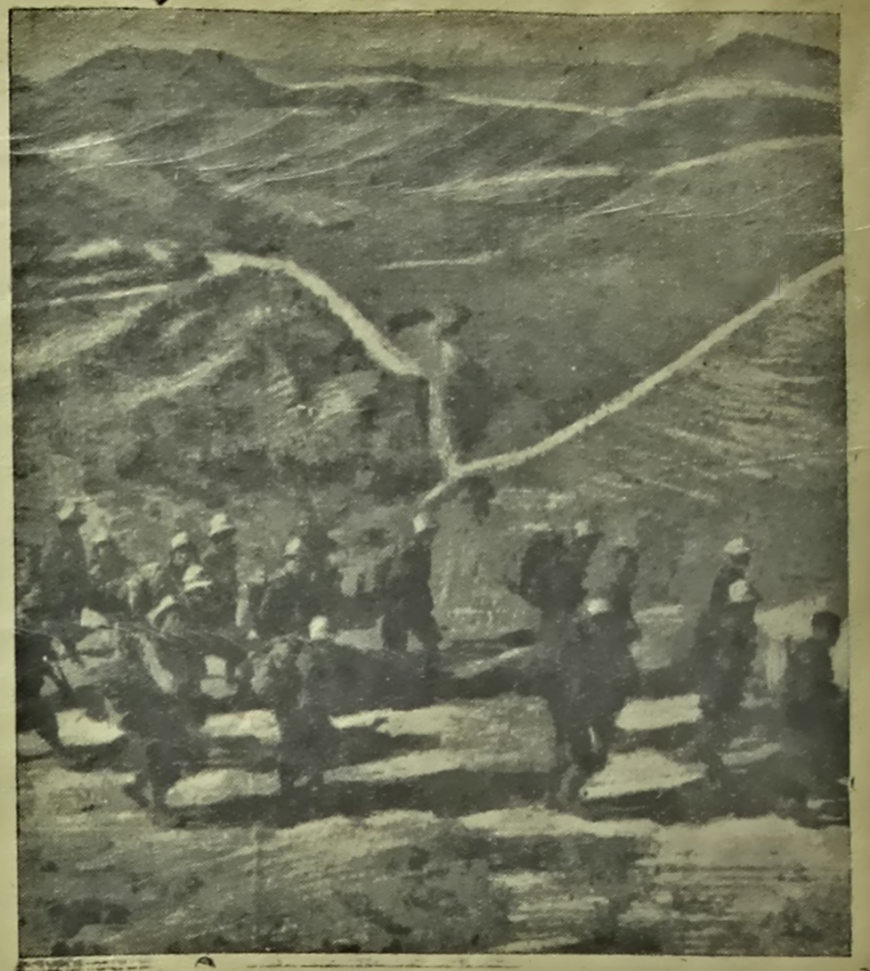
На здымку: Горны пераход італьянскай войскай часткі ў Афрыцы.

Як указвае агенства, у дэталітачных кругах заўважаюць, што Германія патрабуе пазначэння Лавала міністрам унутраных спраў.