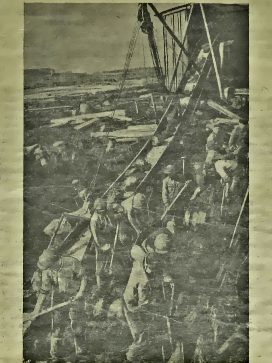
На торфаводзе «Міхановічы» (Міскі раён) пачалася здыбчы торфу. Пучыны ў работу ўсе 4 велеватарыя машыны завода.

упраўляючы абласной каторы белааруднааплодгародніцтва.