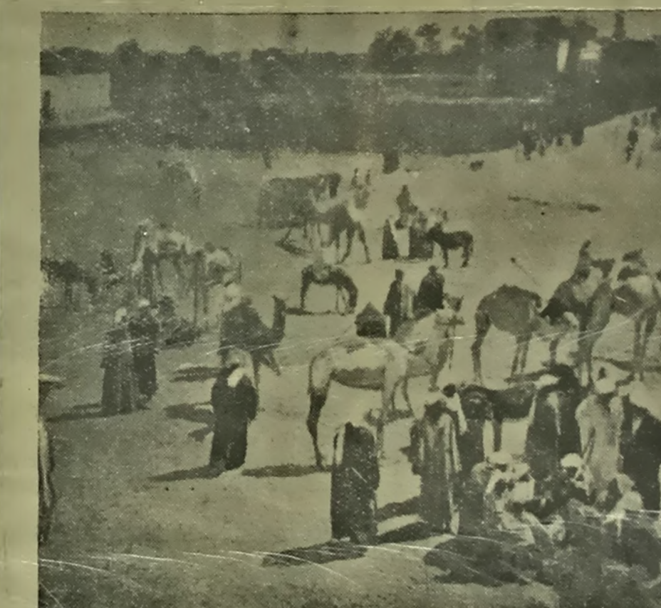
Від адной з рыначных плошчаў Каіра (Егіпет).

пуюкі афты і газы. Рух пратонных аўтамабіляў рэзка скарачаецца. Волпуск газы насельніцтву зведзена да мі-німальных размераў.