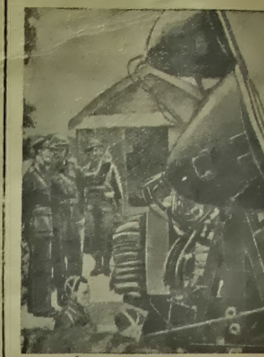
Магутны пражажтарны ўстаноўка на тэрыторыі Англіі. Фотахроніка ТАСС.

Для ўмацавання амерыканскай арміі - павятрапага флота, заявіў дадэй Стымсон, неабходнае час. Толькі захаванне англій-скага ваенна-марскога флота можа гаран-тыраваць ЗША час, неабходны для ўзмац-нення іх узброеных сіл. Стымсон сцвяржае, што праграма пе-радачы ўзбраення ў займы або ў арэнду з'яўляецца недастатковай. Германскі па-пад на галілевае суднаходства паражжае «англійскай жыццёва-важнай лініі». ЗША ўладаюць дастатковай ваенна-мар-скай магутнасцю, каб справіцца з гэтай пагразай. Памцаючы дзеянні англій-скага ваенна-марскога ф л о т а ваенна-марскія сілы ЗША могуць зрабіць безапаснымі аяны, акру-жаючы амерыканскі капітант з поў-начы, з поўдня, захаду і ўсходу. Такім шляхам флот ЗША можа дапамагчы стры-маць хуткае наступленне дзяржаў асі, пакуль не будзе атрымана асталія аба-ропа. У праціўным выпадку, калі флот ЗША ўстрымаецца ад аказання дапамогі да таго, часу, пакуль будзе зломлена ма-гутнасць англійскага флота і Англіі ў ця-ля, то сіла флота ЗША скараціцца да нікчэмнай долі яе цяперашняй магутнас-ці.