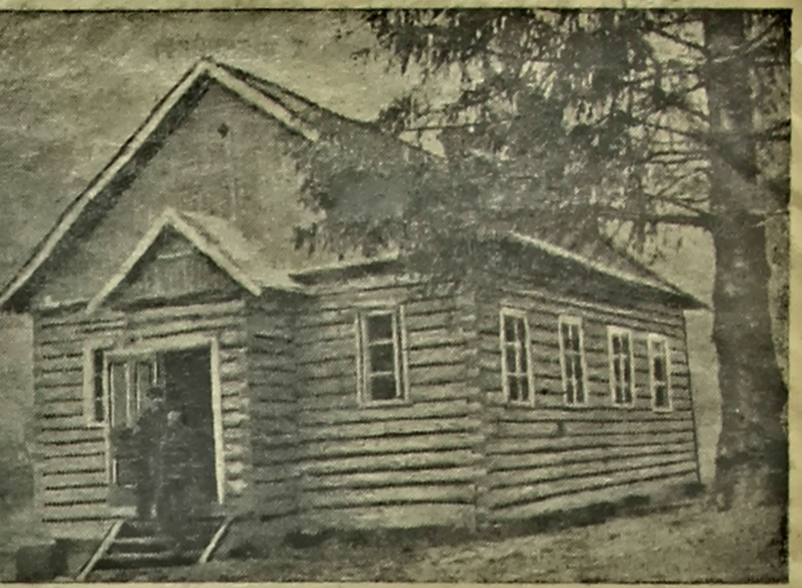
НА ЗДЫМКУ: ушоў пабудавана лавка для работных саўгаса «Остражына». Саміцкікага раёна.

Старшыні выканкома Гомельскага абласнога Савета дэпутатаў працоўных прапанавана забяспечыць выкананне аўтабазы абслугоўвання паставы ўрада аб нормах расходвання гаручага; спыніць работу газогенератарных машынаў на бензіне; спыніць водпусце на старану гаручага і увесці строгі ўлік пастануплення і расходвання нафтапрадуктаў. (ВЕТА).