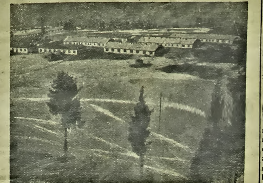
На здымку: агульны выгляд рабочага пасява рудніка Ак-Тюз. Пасялак размешчан у гарах Кіргізіі на вышыні звыш 2 тысяч метраў.

Гэтым здзіравілася ўсё сёла. Былі выказаны розныя агадакі. У хуткім часе ўдзельні ўстававілі, што незвычайная з'ява — вынік спазвання ўніз часткі гадры, якая знаходзіцца ў 400 метрах ад сёла. Міркуюць, што адбыўшыся апоўтні выкліканы надзіўнымі землятрасеннем.