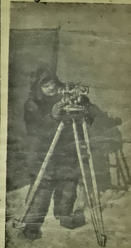
На ільціне М 2. Магнітолаг-аэравом М. Е. Острэкін вызначае месцазнаходжа-ва лагера. Фота Камашыра самалета СССР «Н-169». І Чэрэвічава Фотазоніка ТАСС.

фазола ўжо выпусціў завод Абрахін. Пу-шчана ўстаноўка на Акадэмічным заводзе, якая ў бліжэйшыя дні дасць першую прад-дукцыю. На працягу года гэтыя прадпрыемствы выпусцяць каля 8 тон каштоўнага прэпа-рата.