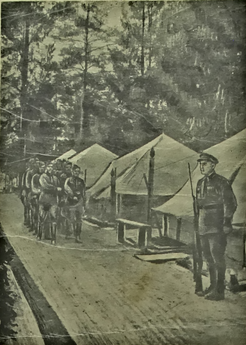
Падразьлежэнне капітана ордэнапаца тав. Аляксеева першым у Нэскай частці ЗахАВА вышла ў летнія лагеры. НА ЗДЫМКУ: на пародній лініі лагера.