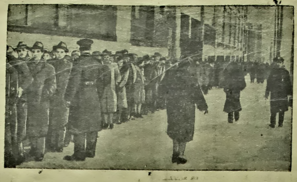
У часціні работы ў Нью-Йорку.

Іто ў Лівіі канцэнтрыруцца германска-італьянскія войскі, як відаць, з мэтай наступлення на Бігет. Цяперашняе становішча ў Лівіі напамінае сабой абстаноўку, якая была там перад тым, як італьянскія войскі перайшлі егіпецкую граніцу летам мінулага года. Побач з гэтым, падкрэслівае далей агенства, неабходна адзначыць істотныя адрозненні ў абстаноўцы ў параўнанні з мінулым годам. У той час Італія мела тут вялікую, добра ўзброеную армію. На абшарнай тэрыторыі Лівіі былі створаны велізарныя пасяння склады і валакія зшасы гаручага. Порты на лівійскім узбярэжжы былі ў пераўраўнаважым стане, чым та пер, пасля бамбардзіровак. Апрача таго, перад праціўнікам не станала пагрозы ўдару з фланта, якая цяпер мячыма з Тобрука.