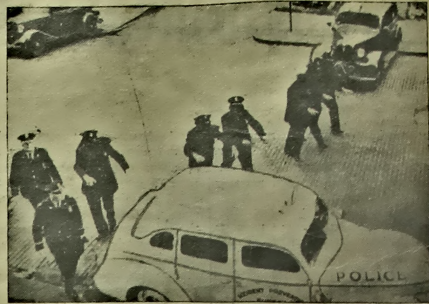
Лінійныя вучанні па зацяпенню ў Сііле (ЗША). Паліцэйскія ў спецапрапагандавых масках.