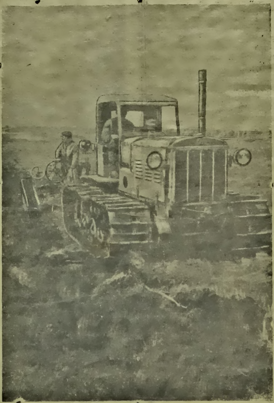
Ворыва асушанага балота ў калгасе «За ўладу Советам» (Бабруйскі раён, Магілёўская обл.) пад кіраваннем чукровых бурнакоў. За работай балотны трактар Гарабалотніцкай МТС.

І кроць з паўнасьцю да хаты, Іно ён тут не раз бываў, Забэг наперад чорт лазы, Нількуў хвастом і ззыптам;