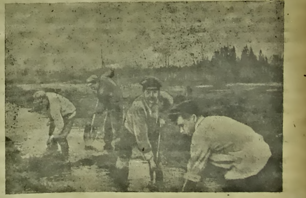
Масавыя мелярацыйныя работы на асушчэньня балот разгарнуліся ў Барысаўскім раёне, Мінскай абласці. На здымку калгас «Чырвоны Кастрычнік» пракадаваў магістраўны канал даўжынёю 3 тысячы метраў, дэ работуюць брыгады 3 калгасаў — імені Калініна, «Чырвоная Слабода» і «Чырвоны Кастрычнік». На здымку: За работай адно з лепшых званяў калгаса «Чырвоная Слабода».