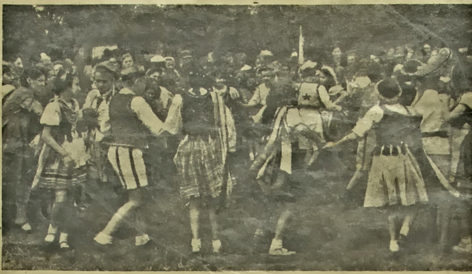
Веседа праводзіць першыя дні канікул вучні нашай абласці. На здымку: Танцавальны турток Брэсцкай першай польскай школы ў парку культуры і адпачынку ім. I Мая выконвае польскія народныя танцы «Кравяк».

У другі раз работнікі народнай асветы, уся совецкая грамадзкасць падтрымлівае ўсе гэтыя работы па будаўніцтву новай сямейнай школы на вызаленай зямлі. І ў гэты момант невялікія, але значныя, зручальніцы збудаваны і аднавіліся. Успешна выконваюцца работы па правядзенні сапраўднага ўсеагульнага навучання на роднай мове. Успешна выконваюцца работы па правядзенні сапраўднага ўсёагульнага навучання на роднай мове. Успешна выконваюцца работы па правядзенні сапраўднага ўсёагульнага навучання на роднай мове.